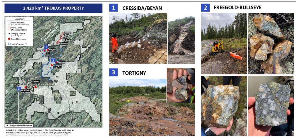
Abbildung 1: Liegenschaft Troilus und regionale Explorationsziele

Mineralfortsetzung in Tiefen von bis zu 100 Metern unter den Vorkommen an der Oberfläche. Das Programm war außerdem auf die Prüfung interpretierter Strukturabschnitte von in geophysikalischen Daten identifizierten Ost-West-Strukturen, mit einer Nordost-Südwest verlaufenden Scherzone am Kontakt der ultramafischen und Tonalit-Pakete, ungefähr 400 Meter von dem im Jahr 2020 beprobten Hauptvorkommen entfernt, ausgerichtet. Die Scherzone, die von Nordost nach Südwest verläuft, liegt parallel zu dem Hauptdeformationstrend im Minengelände Troilus und stellt potenziell einen wichtigen Flüssigkeitszulauf dar, der die Mineralisierung in der Region Testard liefert.