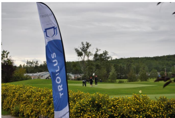
Principal commanditaire du tournoi de golf organisé à Chibougamau par Centraide

Troilus est fière de contribuer au dynamisme des communautés locales en parrainant des activités et des événements qui favorisent la jeunesse, les modes de vie sains, la culture, l'engagement social et l'éducation. En dépit des restrictions actuelles causées par la pandémie de COVID-19, nous avons tout de même trouvé des moyens de soutenir les communautés locales et de réunir les gens de manière sûre.