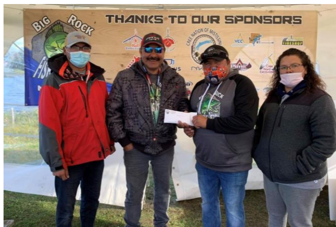
Commanditaire du tournoi de pêche de Big Rock