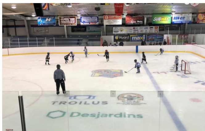
Commanditaire du tournoi de hockey pee-wee de Chibougamau