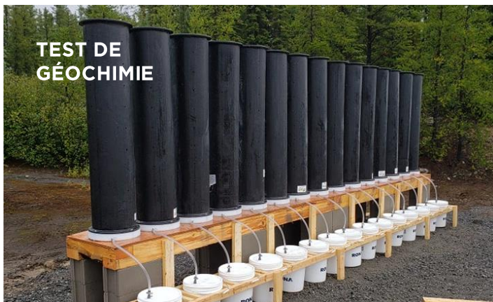
TEST DE GÉOCHIMIE

Étant donné qu'il s'agit d'un site de mine fermée, les résidus de l'ancienne mine nous aident à déterminer comment mieux l'exploiter à l'avenir. Cette année, l'équipe responsable de l'environnement a commencé un test de géochimie sur les déblais des stériles de la fosse J4 avec l'appui du gouvernement du Québec et du Conseil national de recherches. Les résultats permettront de déterminer si des contaminants s'échappent des stériles au fil du temps et seront pris en compte lors de l'élaboration de nos pratiques de gestion des résidus miniers.