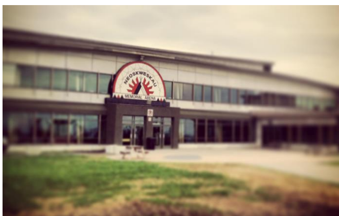
Commanditaire du programme de Mistissini Sports & Recreation